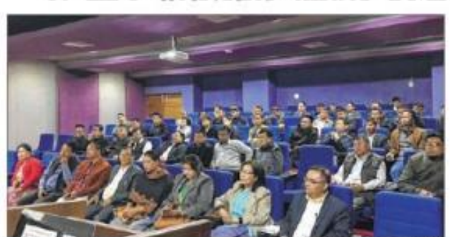
IMPHAL, Feb 17

The Town Planning Department, Manipur organised the 4th City Level Workshop on MIS, Geotagging and IEC activities under Pradhan Mantri Awas Yojana (Urban) at City Convention Centre, Imphal today.