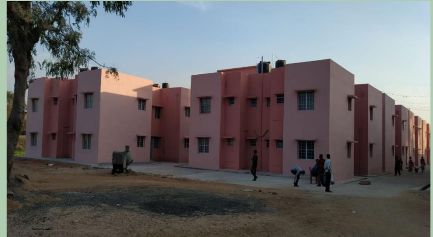
Kalirekha Kust Ashram, Deoghar