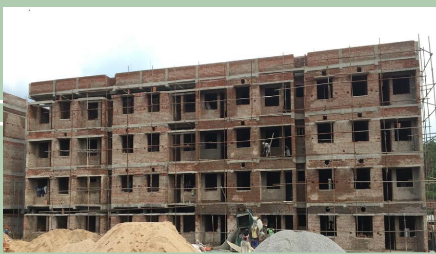
Birsa Smriti Park, Ranchi