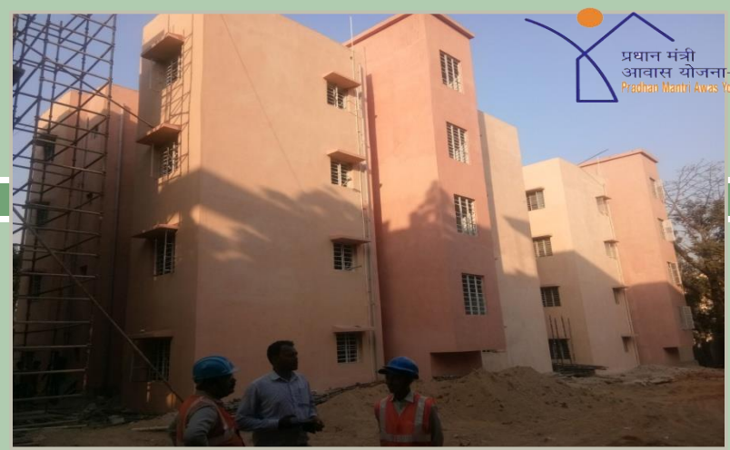
Navjivan Kust Ashram, Jamshedpur