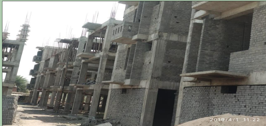
Islam Nagar, Ranchi