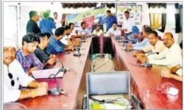
बैठक करते नगर परिषद अध्यक्ष व अन्य.